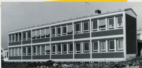
Die Südfront der Mädchenschule im Jahr 1967

Zu den wichtigsten Infrastrukturmaßnahmen gehörten der ab 1954 durchgeführte Aufbau einer zentralen Wasserversorgung und einer Kanalisation mit der ersten Kläranlage im Landkreis. Schule, Kindergarten und Krankenhaus zogen in neue Gebäude. Der Markt konnte sich jetzt auch den Luxus eines Hallenfreibades auf dem Weidhausberg leisten.